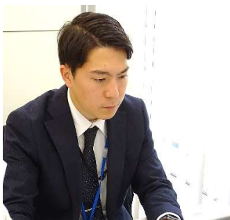
2020年4月入職 大泉支店 渉外担当

J A東京あおばで活躍する若き職員たち。入組して数年。日々成長し、地域に貢献する姿を紹介します。