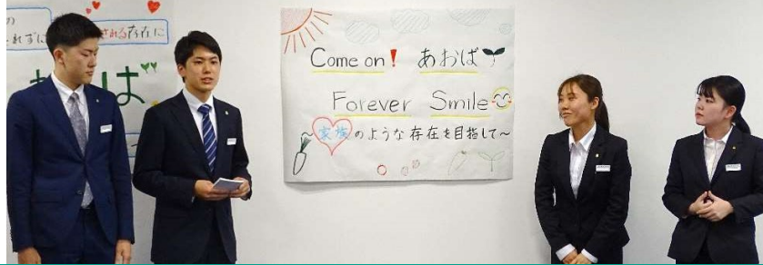
2023年 新入職員フォロー研修の様子