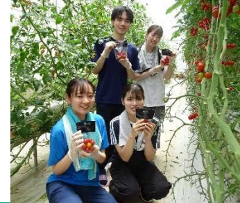
2024年 農業体験の様子