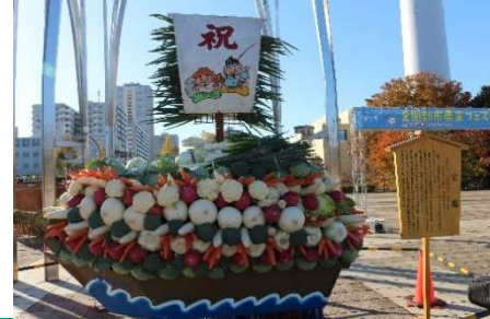
宝船 (2023年農業祭にて)