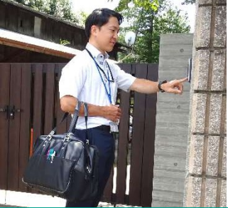
渉外担当顧客訪問の様子